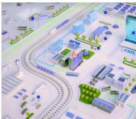
宁德时代计划在印尼建厂 将投资5