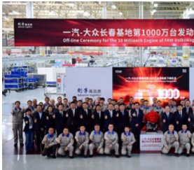
一汽-大众第1000万台发动机下线

“华谱奖”作为品牌节最重要的奖项，以“品牌，让中国更受尊敬”为理念与标准，代表中国自主品牌建设的最高荣誉。该奖项每年评选一次，获奖企业均为年度内最能代表国家品牌形象的典