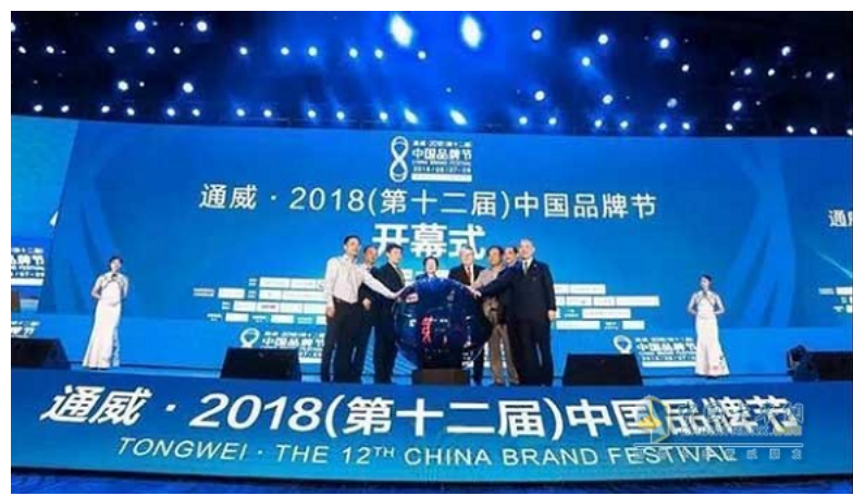
第十二届中国品牌节

范品牌。此次盛会上，双星以其在品牌建设领域的卓越成绩、在企业加速智慧转型创新发展中对行业的贡献和在民族品牌中的引领作用，从众多企业中脱颖而出，成为中国自主企业品牌的典范。在颁奖典礼上，评委会对双星给予了高度评价：“推动了中国轮胎产业的创新发展，为行业树立了科技和性能的新标杆”。