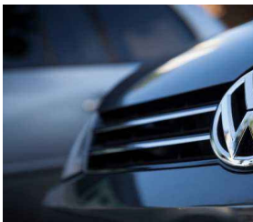
大众在欧洲或需要40座电池厂