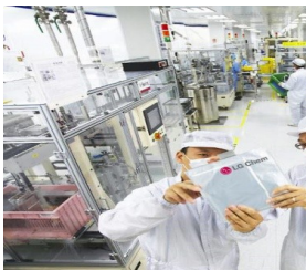
LG化学高镍电池预计明年交付特斯